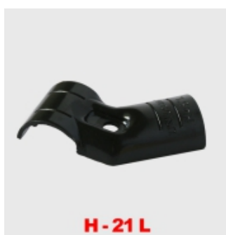
H - 21 L