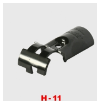
H - 11