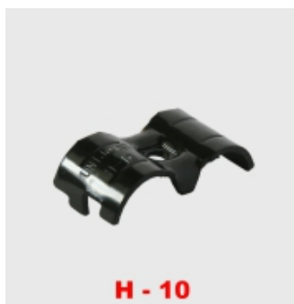
H - 10