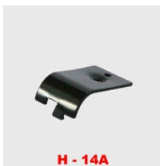
H - 14A