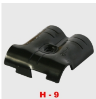
H - 9