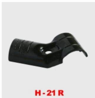
H-21 R Bilincs