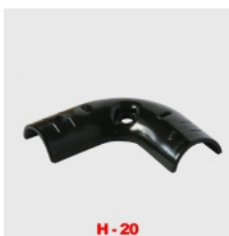
H - 20