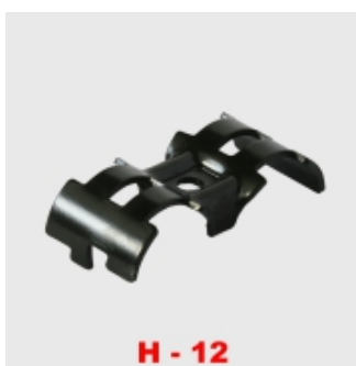
H - 12